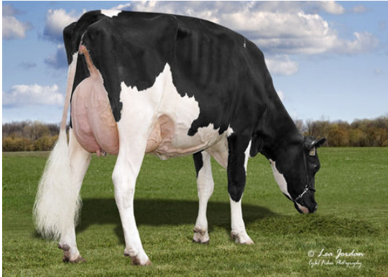
JIMTOWN KD NARCISA DAM