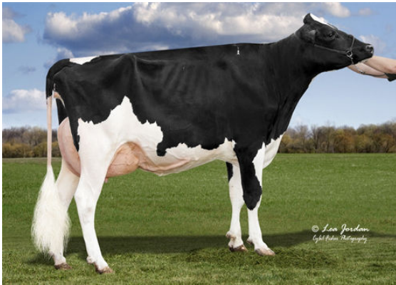
JIMTOWN KD NARCISA DAM